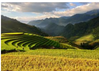
Hanoi 📍 🚗 200km - ⌚ 5h Muong Lo 📍