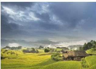
Hanoi 📍 330km - 🕒 8h Ban Luoc 📍