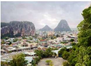
Hue 📍 🚗 90km - ⌚ 2h Danang 📍